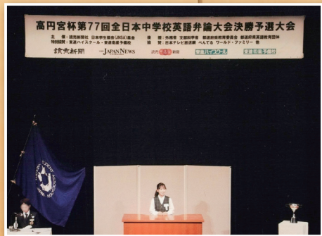
全日本中学校英語弁論大会の様子