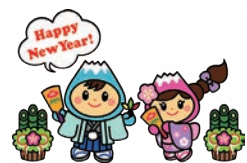
富士見市マスコットキャラクター 「ふわっぴー」

児童福祉ボランティアグループまい まい ／時①児童養護施設の子どもた ち一人ひとりに誕生日プレゼントと 卒業祝いを作って届けてくれる方② バースデーカードなどを作ってけれ る方費①月会費500円②なし問谷脇 ☎090-1437-6410