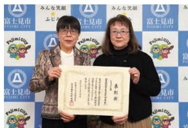
児童福祉ボランティアグループ まいまい

彩の国コミュニティ協議会では、住みよい地域社会の実現のために、積極的な実践活動を行っている個人、団体の方にシラコバト賞を贈呈し、その活動と功績を顕彰しています。