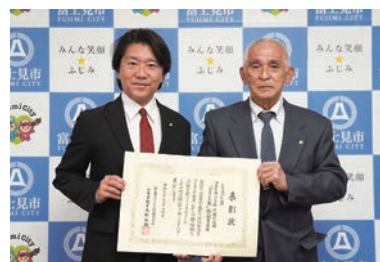
つるせ台小学校学校応援団 「みまもり隊」協議委員会