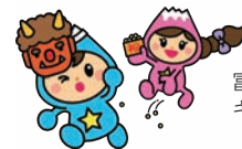
富士見市マスコットキャラクター「ふわっぴー」

七色七味 / 毎月8回木・日曜19:00〜21:00 富士見台中体育館ほか 老若男女問わず よさこい鳴子踊り 年会費あり 無料体験あり(2月16日(日)19:00〜21:00、富士見台中体育館、室内履き持参)、詳しくは「七色七味」で検索 福岡 090-1614-6239