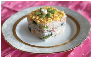
デコレーション寿司

健康増進センター ☎049(252)3771 FAX 049(255)3321 問 申込先