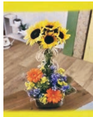
①ひまわりトピアリー