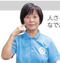
人さし指で頬をなでおろす