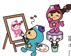
富士見市マスコットキャラクター「ふわっぴー」