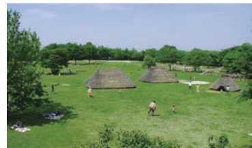
水子貝塚公園(富士見市)