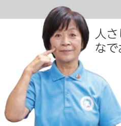
人さし指で頬をなでおろす