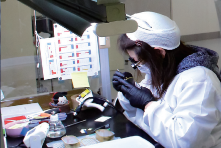
熟練の技術を要する振動膜の埃除去