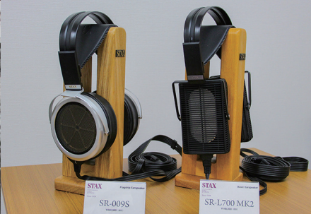
最高クラスモデル(左)とスタンダードモデル