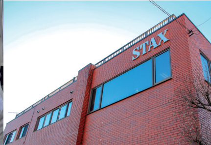
竹ノ内工業団地に構える社屋