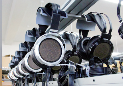
エイジング中のヘッドフォン