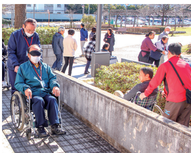
屋外で行われたフィールドワーク

しさを体感でき、セルビアのパラ選手などを迎えるための貴重な体験ができた」との感想があった。