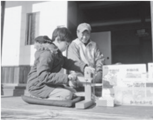
古民家の縁側での綿くり体験の様子

毎週土・日曜、祝日は、ガイドツアーや「ちよこっと体験」のお手伝いをします。毎年6月に開催される「難波田城公園まつり」、4年生以上の小学生を対象にした「夏休み古民家宿泊体験」などのさまざまな行事にも市民学芸員は参加しています。近隣の史跡などを訪ねる管外研修や、お互いの学び