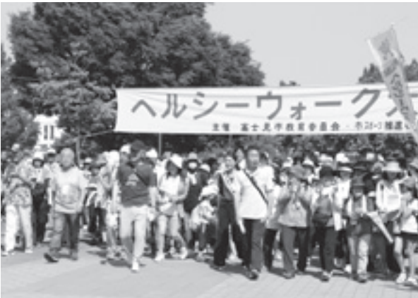
今年度のふじみヘルシーウォーク大会

現在は、毎年開催されるふじみヘルシーウォーク大会、地区体育祭、各種スポーツ大会・講習会など年間を通して