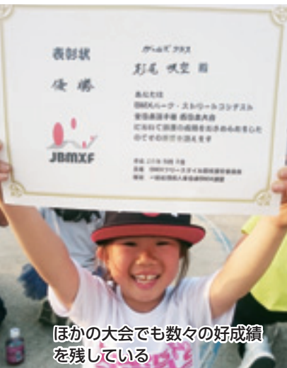
ほかの大会でも数々の好成績を残している

人情の厚いこの地域。古株も若手も活発です。 ―商店会の雰囲気を見せてください。 当商店会は市内で最も古く、地域的にも古くからの住民が多いためか、人情が厚いです。商店会内の世代交代が円滑に進み、古株も若手も活発に商店会運営に参加してくれています。 ―住民参加型の地域イベントへ ―夢灯り大市の特色は。 住民参加型のお祭りにしたかったので、通りに子どもたちが作った灯籠を飾り、福祉団体やスポーツ少年団などにも模擬店を出店してもらっています。また、隣の商店会とも協力し、地域のみんなで盛り上げられるようにしています。 個性のお店の多い鶴瀬駅前通り。個性と活気を活かし、さらに足を運んでみたくなる場所にしていきたいですね。