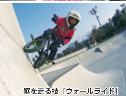
壁を走る技「ウォールライド」