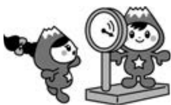
富士見市マスコットキャラクター ふわっぴー