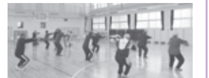
H26年度 脂肪燃焼運動講座のようす