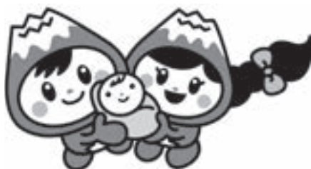
富士見市マスコットキャラクター ふわっぴー

一次申込分は平成29年2月10日(金)までに、二次申込分は3月10日(金)までに結果通知を郵送する予定です。