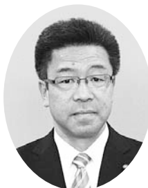
所属会派：21・未来クラブ 当選回数：2回