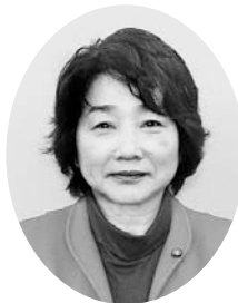
所属会派：公明党 当選回数：4回