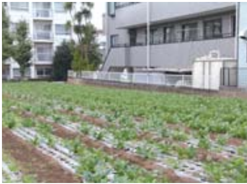
▲住宅地の一角に畑があります