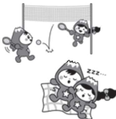
イラストは162点(10月1日現在)ニューバージョン追加中です。

※イラストを使用する際は「富士見市マスコットキャラクターふわっぴー」の表記を入れるなど、使用上の留意事項があります。詳しくは市ホームページ「ふわっぴーのひろば」をご覧ください。