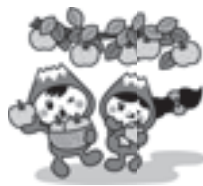
富士見市マスコットキャラクターふわっぴー

ふわっぴーが、ゆるキャラ®グランプリ2015に出場中です。11月16日(月)午後6時まで投票できます。ぜひ応援をお願いします。