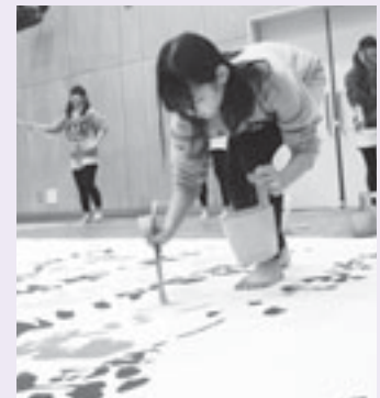
書道パフォーマンス

協賛券 200円 (中学生以下は無料) : 2日間共通、1枚購入いただくとすべてご覧いただけます。