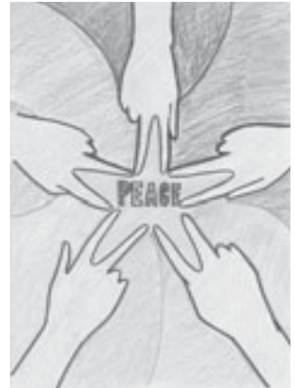
昨年のタペストリー