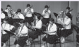
愛と平和のコンサート