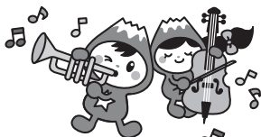
富士見市マスコットキャラクター ふわっぴー

6月20日(土)14:00開演(13:30開場)/鶴瀬コミュニティセンター/昭和の歌、ロシア民謡、シャンソンなどを物語風楽しくつづっていきます/主催ゆうなの会/入場無料/戸部 ☎049-262-4023