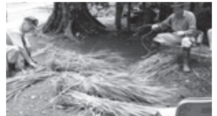
刈り取った「まこも」で馬を編み上げます