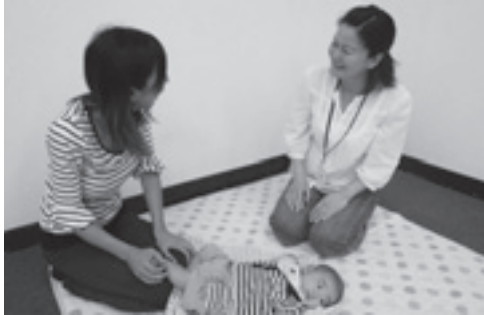
乳児家庭全戸訪問事業のようす

全国的に実施している乳児家庭全戸訪問事業（こんにちは赤ちゃん事業）を母子保健推進員が行っています。母子保健推進員は、町会長の推薦で市長が委嘱した地域に住む先輩お母さんで、現在90人が活動中です。活動をしていくうえで必要な知識や情報を得るため、研修会なども行っています。 訪問では、生後2～3か月の赤ちゃんがいるすべての家庭に母子保健推進員が伺います。赤ちゃんやお母さんのようす、育児に関する不安や悩みを聴かせていただき、必要に応じて保健師との橋渡しをしています。また、子育て支援事業の紹介や地域の子育て