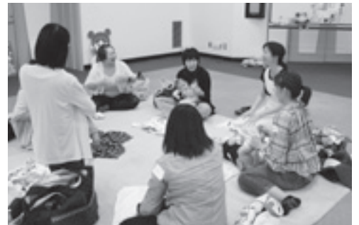
わくわく子育てトークンのようす

全国的に実施している乳児家庭全戸訪問事業（こんにちは赤ちゃん事業）を母子保健推進員が行っています。母子保健推進員は、町会長の推薦で市長が委嘱した地域に住む先輩お母さんで、現在90人が活動中です。活動をしていくうえで必要な知識や情報を得るため、研修会なども行っています。 訪問では、生後2～3か月の赤ちゃんがいるすべての家庭に母子保健推進員が伺います。赤ちゃんやお母さんのようす、育児に関する不安や悩みを聴かせていただき、必要に応じて保健師との橋渡しをしています。また、子育て支援事業の紹介や地域の子育て