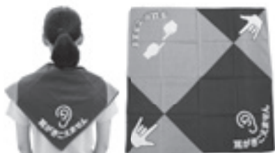
仕様／75cm四方、紫色とピンク色の2色に分かれていて、それぞれ「耳が聞こえません」「手話ができます」と書かれています。

ヘルプカードや聴覚障がい者災害時援助用バンダナを持つている方が困っているときは、皆さんの手助けや配慮をお願いします。