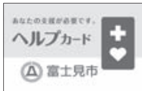
仕様／運転免許証サイズ (蛇腹折り8面、片面4面)、 ビニールケース付

ヘルプカード ヘルプカードとは、援助を必要とする方が携帯し、災害時や緊急時など、いざというときに必要な配慮や支援を周囲の方にお願いするカードです。 対象 ／市内在住で身体・知的・精神障がい者および難病患者で希望する方（障害者手帳の所持は問いません） 配布場所 ／障がい福祉課、富士見市社会福祉協議会 記載内容 ／氏名、住所、生年月日、緊急連絡先、障がいの状況、配慮してほしいことなど、必要であると思う欄を記入 こんなとき役に立ちます ● 日常的にちよつとした手助けが欲しいとき ● 緊急のとき、道に迷ってしまったとき、パニックや発作、病気のとき ● 災害に伴う避難生活が必要なとき