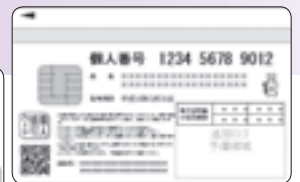
個人番号カード サンプル