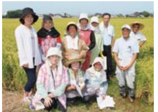
▲母ちゃんたちの田んぼ塾の皆さん

頑張る女性農業者 母ちゃんたちが富士見市産の お米をおいしくする! 女性のための稲作講習会「東大久保・母ちゃんたちの田んぼ塾」は、平成18年に発足し、今年で9年になります。きっかけは世代交代による栽培技術の継承が不足していたことや、毎年変化する気象条件に伴う栽培方法の指導が目的でした。 種まき、苗づくり、刈取り適期、食味診断など、年6回ほど開催しています。川越農林振興センター職員を講師に招き、安全安心で環境にやさしいお米を栽培するために、熱心に学んでいます。