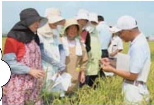
▲刈取り適期を間もなく迎える稲の実り状況を確認(8月下旬)。