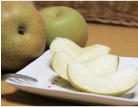
▲みずみずしい梨をどうぞ

「市の特産品はなに?」「梨!」と言うくらい貴重な農産物で、現在市内には14軒の梨農家があります。東大久保の「時田梨園」では、24反の梨園をご夫婦で栽培しています。梨栽培は、収穫が終わってすぐに翌年に向けての作業が始まります。冬の間の剪定と施肥、春先の花粉付けと摘果、収穫時期が真夏という大変な作業ですが、いくら手をかけても終わりが無いという