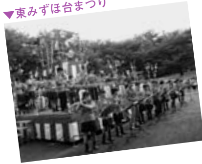
▼東みずほ台まつり