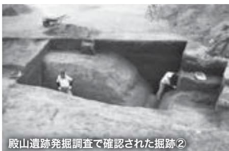
殿山遺跡発掘調査で確認された掘跡②