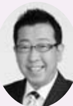
副管理者 高畑 博 (ふじみ野市長)