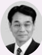
管理者 星野 信吾 (富士見市長)