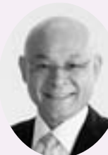
副管理者 林 伊佐雄 (三芳町長)