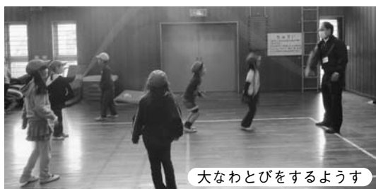
大なわとびをするようす

また、「先生方が協力してくださっているからこそ、活発に活動できているので、活動を継続していくうえで、学校の協力は不可欠ですね。そして、一緒にやっていく人同士が理解し合って、一人で無理したり、抱えたりしないことが大切だと思います」と学