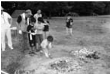
土器焼成のようす