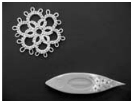
レース編み・シャトル