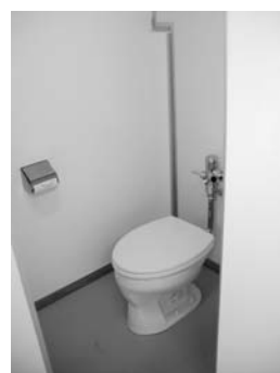
改修後のトイレ(西中学校)

今年度、鶴瀬小学校、西中学校、特別支援学校のトイレ改修工事を実施しました。今回の改修では、和式トイレの大半を洋式化し、床面を家庭のトイレのように整備(ドライ