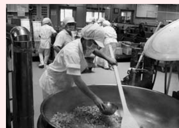
学校給食センター

学校給食は、児童や生徒の心身の健全な発達に大切なものであり、食に関する正しい理解と適切な判断力を養うために重要な役割を果たしています。学校給食には7つの目標があり、給食は「生きた教材」として給食時間や授業などでも活用されています。