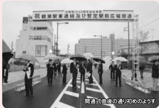
開通式典後の通り初めのようす