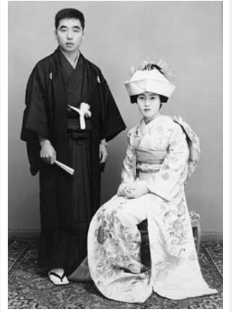
昭和41年の新郎新婦(市内)

※記念写真アルバム、台紙張り六切写真(2面)、当日のようすを撮影したDVDを贈呈します。