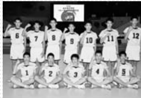
全国大会のメンバー