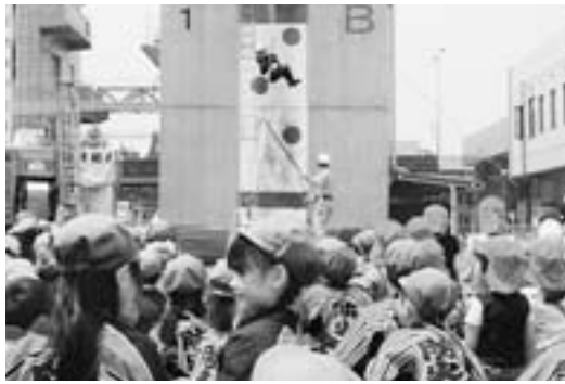
防火のはっぴを着て訓練を見学する園児