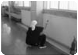
校舎の壁のペンキ塗り

「できることを」「できるときに」「できるところで」「ちょっとだけ」を合言葉に、ちょっとした空いた時間を子どもたちのために有効活用し、活動しています。