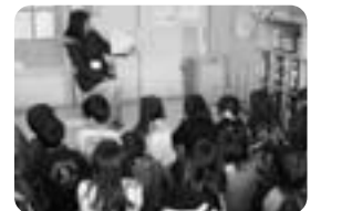
始業前の読み聞かせ

学習ボランティアは、よもぎ団子づくりや毛筆の授業の手伝いなど、環境ボランティアは花の植え替えを中心に学校の美化に取り組んでいます。読み聞かせボランティアは、毎週水曜の始業前に読み聞かせを行っています。