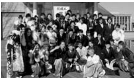
平成24年成人式会場のような

とき／平成25年1月14日（祝） 受付／午前10時30分〜 開式／午前11時 場所／キラリふじみ 対象／平成4年4月2日から平成5年4月1日まで に生まれた方で、市内在住の方