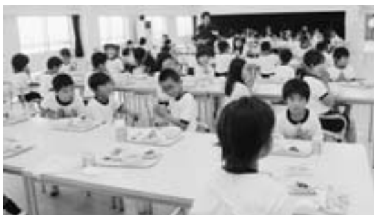
学校給食のようす

市では、人間尊重を基本理念として、市民一人一人が生命を大切にし、思いやりのある豊かな人間性と創造性をはぐくむ教育行政を進めています。今後さらに、その取り組みを進めるため、さまざまな教育活動を行っている市民で構成された富士見市教育振興基本計画市民検討会議の協議などを踏まえ、(仮称)富士見市教育振興基本計画(案)を策定しました。この計画(案)に対し、市民の皆さんから意見を募集します。 募集期間 ／12月10日(月)～平成25年1月10日(木) 意見の提出方法 ／パブリックコメント記入用紙に記入し、郵送・ファックスまたは直接提出してください。 ※市ホームページからも用紙の入手と意見の提出ができます。 計画(案)の閲覧および用紙の配布 ／市役所本庁舎1階「市政情報コーナー」、教育政策課、各公民館・交流センター・コミュニティセンター、中央図書館、図書館鶴瀬西分館、市ホームページ