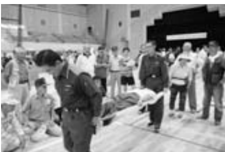
簡易担架作り体験訓練のようす

主催／富士見市、ふじみ野市、三芳町、入間東部地区消防組合、東入間警察署、富士見市消防団、ふじみ野市消防団、三芳町消防団