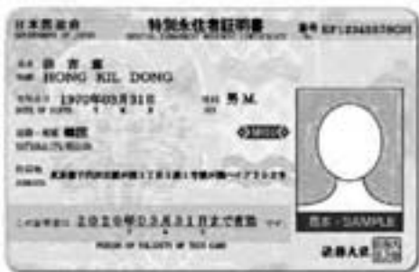
特別永住者証明書見本