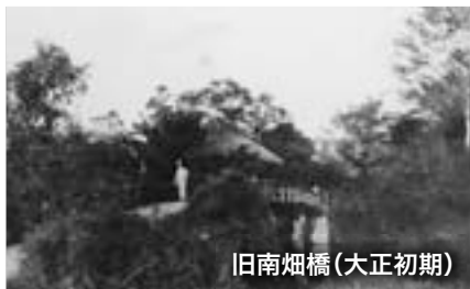
旧南畑橋(大正初期)