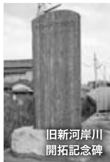
旧新河岸川 開拓記念碑

南畑橋は、蛇木河岸と本河岸の中間にあたり、船着場があり船宿や商店が並び、「橋場」と呼ばれにぎわっていました。現在の南畑橋は河川改修前の橋から50mほど南にあります。その北側には、廃川となった敷地の土地改良の竣工を記念し