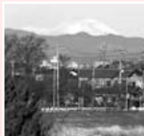
▲川越市街地の先に見えるのは 白い雪をかぶった浅間山。 (北西方向・距離約110km)

冷たい北風に思わず身震いする季節ですが、よく晴れた日には絶好の眺望が楽しめます。市の東を流れる荒川の土手は360度見渡せる展望スポットです。遠くの山々や都心のビル群など、双眼鏡片手に探してみてもいいでしょう。