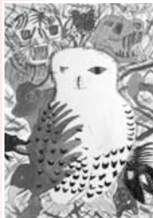
題 「ぶくぶくの仲間たち」

「先生から一言」 シロクワロウを中心に、 たくさん動物たちを、 色彩豊かに描いています。