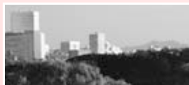
▲大宮駅周辺のビル群とその先には、 わずかに筑波山の姿も。 (北東方向・距離約60km)

▲北関東の先にはうっすらと奥日光の山々 が。ひときわ大きな三角形が男体山です。 (北方向・距離約100km)