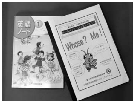
市の独自教材(Whose? Me!)と文部科学省の英語ノート1

新学習指導要領の完全実施に伴い、市では、独自教材「ホームメイド レッスン・エイド Whose? Me!」を市内の小・中学校の先生、AET(英語教育指導助手)、学校教育課の協同作業により作成しました。(A4版片面26ページ、文部科学省「英語ノート」対応) この教材は、児童が友だちやAETとのゲーム活動などを通して、楽しく英語を聞いたり、話したりできるように、また一層外国語に親しめるよう、外国語活動の時間に活用しています。 ※「英語ノート2」対応の独自教材は、来年3月完成の予定です。