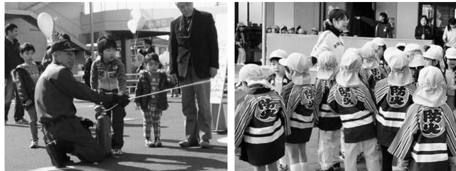
火災予防キャンペーンでの初期消火体験 園児が「防火」のほっぴを着て通園し、火災予防をPR

春先は風の強い日が多く、火災が発生しやすい時季です。消防署では、みなさんの防災意識をさらに高めていただくよう、火災予防キャンペーンを行いました。火災の発生を防止し、万一発生しても、尊い生命と貴重な財産を守る事が目的です。住宅用火災警報器の設置推進と不適正販売への注意、老朽化した消火器の破裂事故への注意のほか、放火による被害の防止策をお知らせしました。また、大型店舗などを対象にした特別査察や、家庭内の防火対策の普及を目的に、消防職員・消防団員が一般家庭を訪問し、防火診断を行いました。