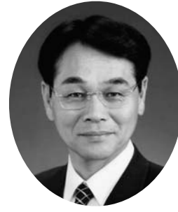
副管理者 星野 信吾 (富士見市長)