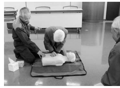
訓練中には、多くの質問をいただきました。

2月8日に、ふじみ野市大井総合福祉センターで、ふじみ野市視覚障害者の会「あいあい」のみなさんを対象とした救急訓練を実施しました。日ごろ、訓練への参加機会が少なく残念に思っていたという会員のみなさん。「災害などが発生した時に協力したい」と積極的に訓練に取り組んでいました。