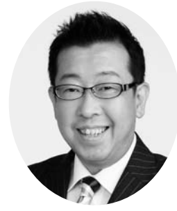
管理者 高畑 博 (ふじみ野市長)