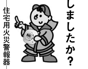
住宅用火災警報器