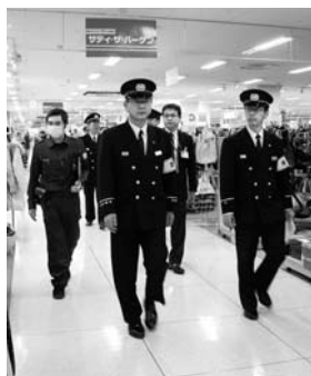
消防長による査察(大井サティ)