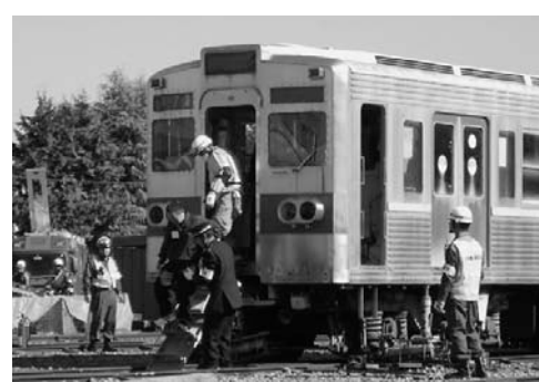
緊急停車した電車から乗客を救出する隊員(訓練)

11月5日、秩父鉄道検車区で、県内36消防本部の参加による大規模災害を想定した鉄道災害訓練を実施しました。