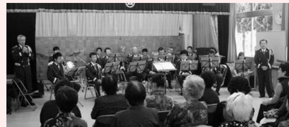
講話の後、消防音楽隊の演奏でリラックス