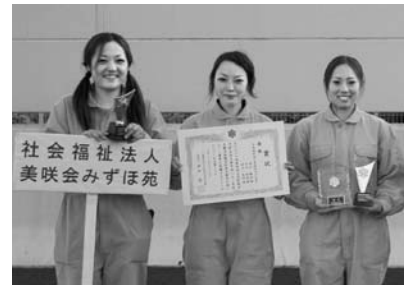
優勝：社会福祉法人 美咲会みずほ苑チーム