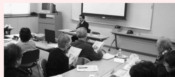
火災の主な出火原因と対策を講義