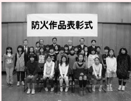
防火作品の表彰が行われました

昨年1年間に、富士見市・ふじみ野市・三芳町での火災発生状況は、合計62件で、逃げ遅れによる死者が増えました。このような火災を未然に防ぎ、住民のみなさんに火災予防の意識を高めていただくために、消防署では、火災予防キャンペーンや一般家庭の防火診断、また、事業所の火災予防特別査察などを実施しました。