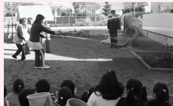
先生の初期消火訓練を真剣に見守る園児たち