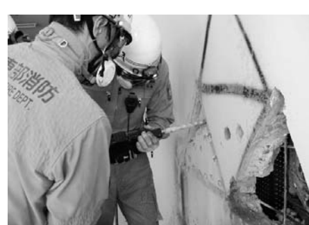
救助資機材でコンクリート壁に救出用の穴を開ける隊員(訓練)

11月11日、川越市内で、解体予定の旧県立図書館建物を利用して、近隣消防本部合同で穿孔技術訓練を実施しました。