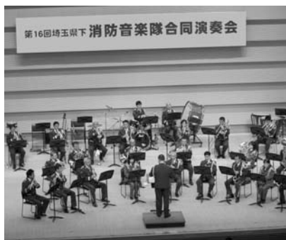
入間東部地区消防音楽隊の演奏の様子

当消防組合音楽隊は、消防・救急隊員などの消防職員で構成され、ほとんどの隊員が音楽隊に入隊して初めて楽器を始めました。