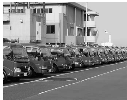
2市1町の消防団員と消防団車両が集結