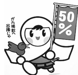
がん検診受診率50パーセント達成に向けた厚生労働省のイメージキャラクター