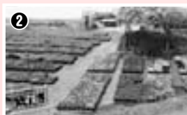
2 人間東部むさしの作業所の花畑。施設で栽培した草花の直売も行われています。