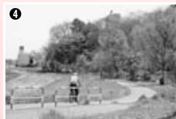
4 水子地区の斜面林を見ながら軽快に進みます。

人口と世帯数(5月1日現在) 人口…107,118人(前月比+117人) 男 53,715人(前月比+66人) 世帯数…46,011世帯(前月比+87世帯) 女 53,403人(前月比+51人)