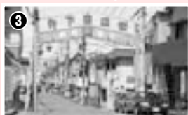
3 中間に位置する寺下商店街は喫茶店や食事処などもあり、ひと休みできます。