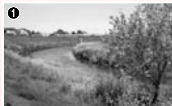
1 のどかな風景が続く新河岸川に沿って。