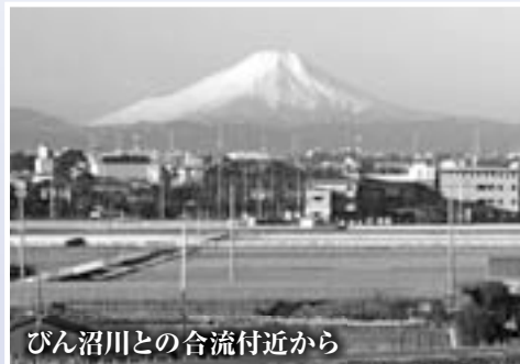
びん沼川との合流付近から