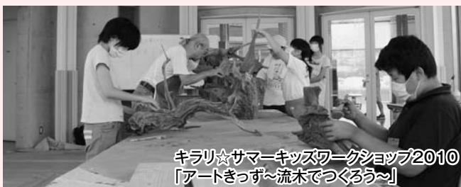
キラリ☆サマーキッズワークショップ2010 「アートきっず～流木でつくるう～」

④アトリエ 水の広場に浮かぶ明るい空間です。絵画用のイーゼル・石こう像・ろくろや水場もあり、美術の創作に適しています。