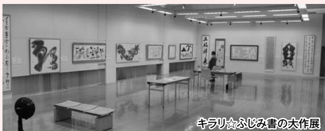
キラリ☆ふじみ書の大作展

②展示・会議室 ③展示室 壁面が展示用有穴ボードになっており、可動式パネル(②のみ)・スポットライトのレイアウトも変更できます。展示はもちろん、会議室としても利用できます。