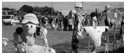
昨年のかかしコンテスト

とき ／11月3日(祝)午前10時～午後2時 ※小雨時は縮小開催 場所 ／南畑幼稚園周辺の田んぼ 内容 ／ イベント かかしコンテスト、農耕機試乗体験、さんだら飛ばし、焼きいもコーナー