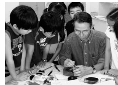
篆刻教室のようす