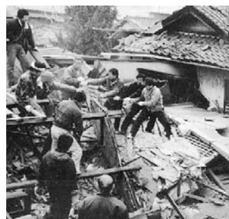
左の写真は、阪神淡路大震災で、倒壊家屋から近隣住民の方が協力して救出活動を行っている写真です。