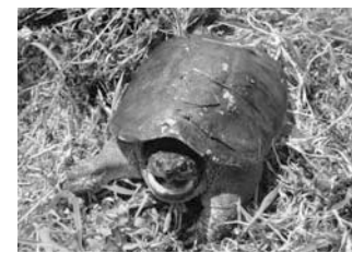
カミツキガメ (体長50センチメートルくらいで、主に水中にいますが、陸にいた場合は攻撃的で危険です)

県内で目撃される特定外来生物のうち、写真のような動物を見かけたら、決して手を出したりせず、環境課へご連絡ください。