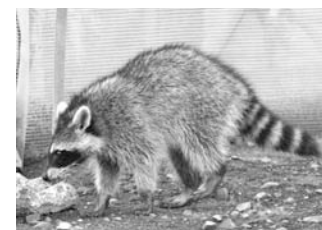
アライグマ (たぬきと似ていますが、しっぽにしま模様があるのが特徴です)