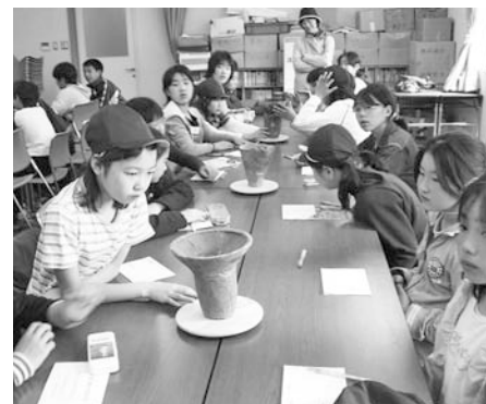
小学校での学習利用