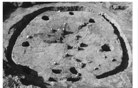
①稲荷前遺跡の竪穴住居

化財(包蔵地)があります。これらの遺跡の時代は、旧石器時代から江戸時代までさまざまです。教育委員会では、開発などで保存できなくなった遺跡の発掘調査を行い、記録だけでは知ることのできない市の歴史や文化を明らかにしています。詳しくは、市ホームページ「富士見市の歴史と文化財」をご覧ください。