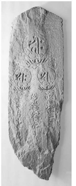
③私年号の刻まれた板碑

に築きあげた土塁との高低差が3メートルほどになり、大規模な館だったことが想像されます。出土品には多門氏以前の時代のもものもあり、中世の城館跡を再利用した館だったことが伺われます。