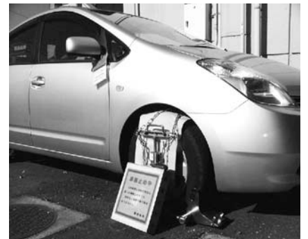
タイヤロックを使用した車の差押え